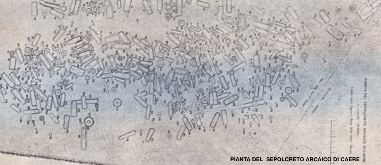
PIANTA DEL SEPOLCRETO ARCAICO DI CAERE

arcaiche a fossa e a pozzetto in occasione della visita del Congresso Internazionale di Archeologia nel 1913; e quelle tombe furono visitate da molti congressisti. Ma il sepolcro ivi si estende denso, e fra le tombe a inumazione e a incinerazione vi sono anche delle tombe a camera di varie età. Negli anni successivi al 1913 io feci in quel luogo, a intervalli, compatibilmente con lo svolgimento del programma di scavo nella parte monumentale della necropoli etrusca, poche altre esplorazioni, le quali diedero risultati notevoli, sebbene effettuate sopra una superficie piccolissima. Ma l'imbarazzante risposta non termina qui, e riserva un'altra bacchettata al Podestà e ai suoi predecessori: "Io smisi ogni ulteriore scavo per gli ostacoli che incontrai da parte degli amministratori del Comune in quel tempo, e che non ridondano a onore di essi. Per la quarta parte del valore dei materiali archeologici rinvenuti nella limitatissima esplorazione, parte che spettava alla pro-prietaria Università Agraria, furono a questa liquidate L. 400.