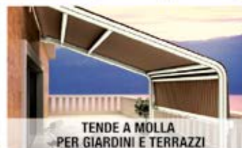
TENDE A MOLLA PER GIARDINI E TERRAZZI