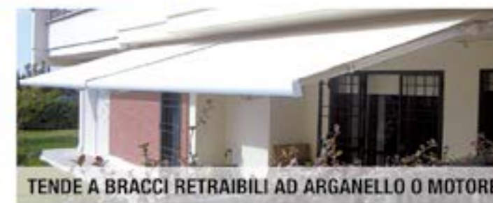
TENDE A BRACCI RETRAIBILI AD ARGANELLO O MOTORE