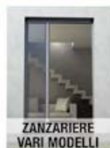
ZANZARIERE VARI MODELLI