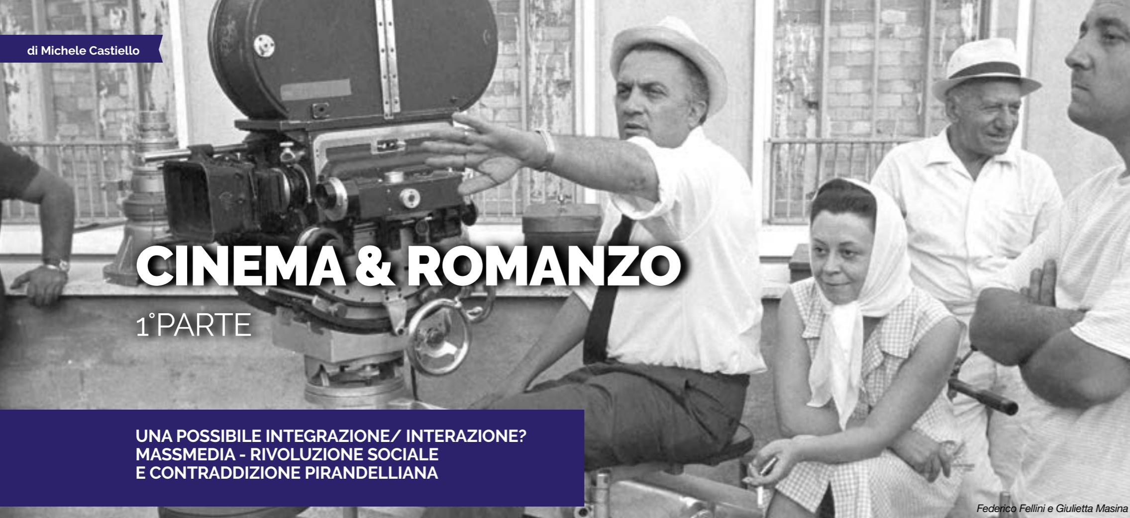
Federico Fellini e Giulietta Masina

UNA POSSIBILE INTEGRAZIONE/ INTERAZIONE? MASSMEDIA - RIVOLUZIONE SOCIALE E CONTRADDIZIONE PIRANDELLIANA