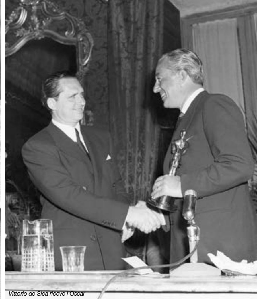
Vittorio de Sica riceve l'Oscar