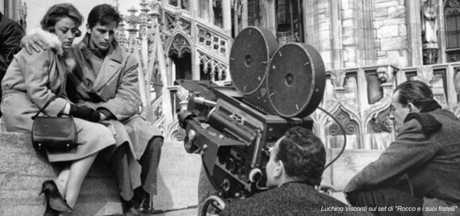
Luchino Visconti sul set di "Rocco e i suoi fratelli"