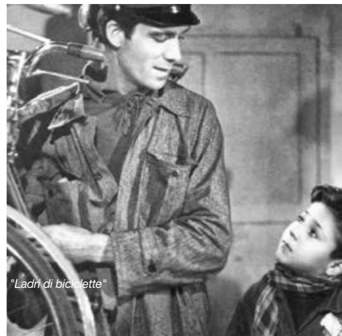
"Ladri di biciclette"

HAIR & BODY BOUTIQUE FRANCHISING ITALIANO