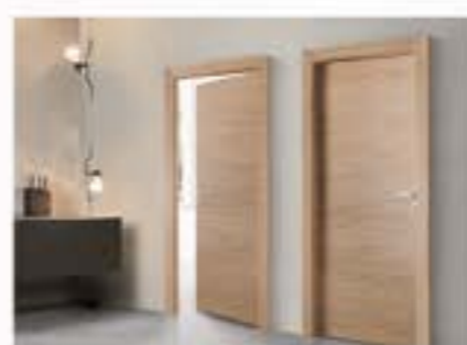
Porte in legno