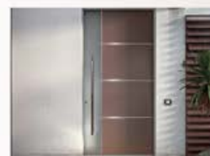
Ponzio 100 Portone in alluminio blindato