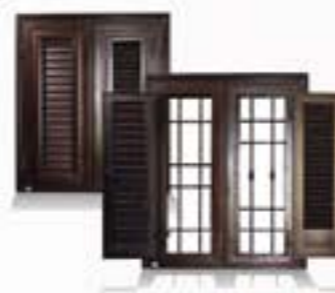
Lavorazioni in ferro