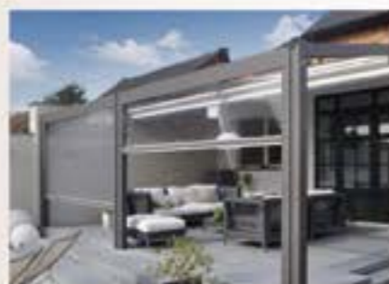
Tende da sole Pergotende

INFISSI E PERSIANE IN ALLUMINIO ANTIEFFRAZIONE RC3