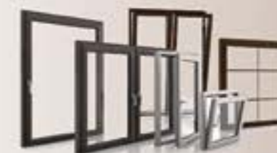
Infissi in alluminio e alluminio-legno

www.tieffeinfissi.com info@tieffeinfissi.com