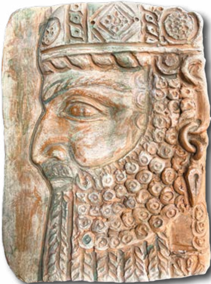
Uno dei lavori degli allievi