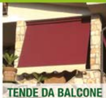
TENDE DA BALCONE