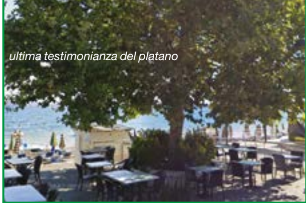
ultima testimonianza del platano