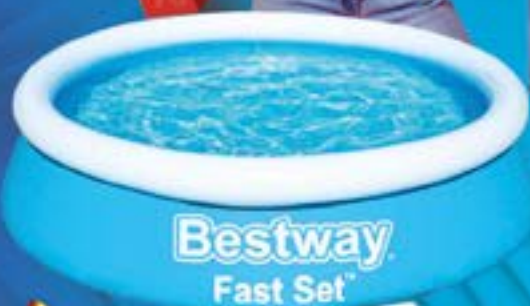
Bestway Fast Set

BESTWAY PISCINA FAST SET 183X51 CM AUTOPORTANTE