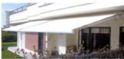
TENDE A BRACCI RETRAIBILI AD ARGANELLO O MOTORE

MONTAGGI ANCHE NELLE ZONE DI ROMA E LAZIO