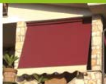
TENDE DA BALCONE