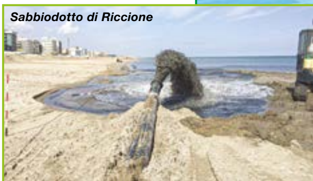
Sabbiodotto di Riccione