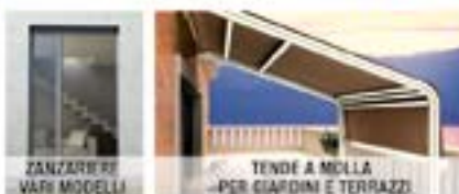
ZANZARIERE VARI MODELLI