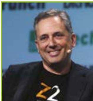
David Sacks ex dirigente di PayPal