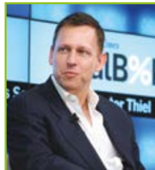
Peter Thiel tra i fondatori di PayPal, a capo di Palantir, gigante della sorveglianza digitale

MAURIZIO MARTUCCI: "DAL BILDERBEG A TRUMP FINO A META, TUTTI IN CORSA PER ARRIVARE ALLA CONVERGENZA TRA UOMO E TECNOLOGIA DELLA POSTUMANITÀ"