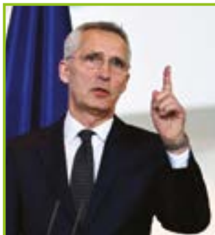
Jen Stolterber ex guida NATO a capo del direttivo Club Bilderberg