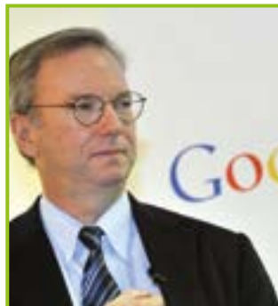
Eric Schmidt, ex Google, capo di una azienda che vende droni kamikaze